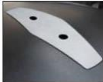
Cenicero en la parte superior

Otros colores disponibles sujeto a pedido mínimo.