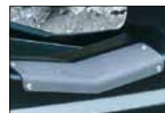
Placa apaga-cigarrillos en las aperturas