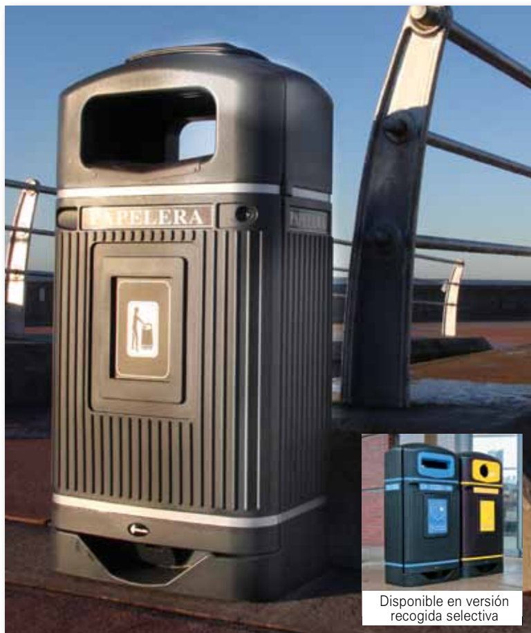
Disponible en versión recogida selectiva