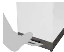
Uso del pedal