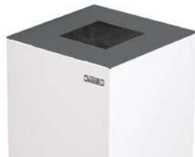
Tapa Abierta (estándar)