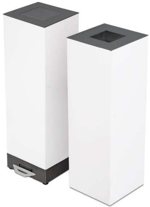
Alicante Office color Gris