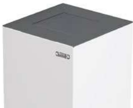
Trampilla accionada mediante pedal