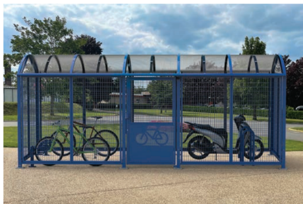
Ref. 529096 + 207310 + 201057