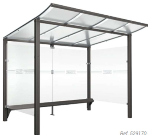
Ref. 529170 + 209147