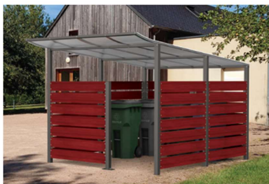
Ref. 529782 + 529787