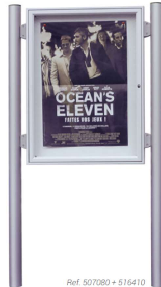
Ref. 507080 + 516410