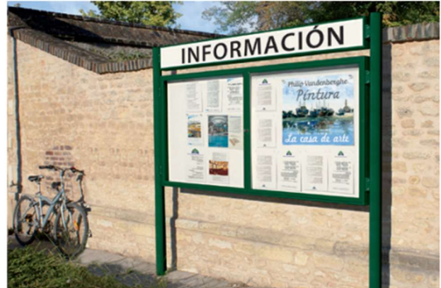
Ref. 414021 + 402917 + 416411*