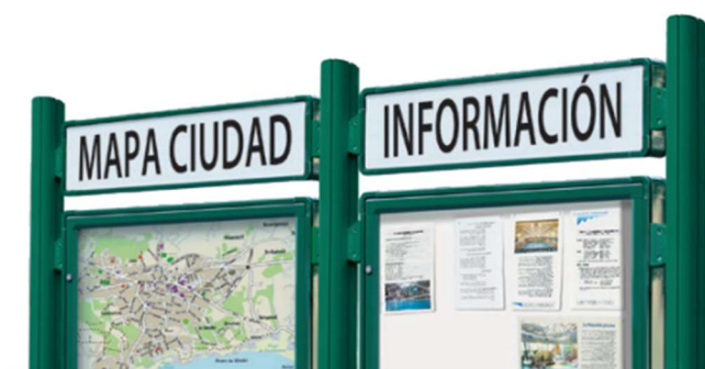
Banda título para vitrinas 2000*