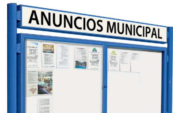
Banda título para vitrinas 1000*