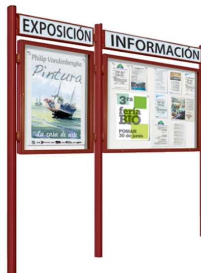
Ref. 407081 + 407080 + 416404 + 416406 + 402912 + 402910