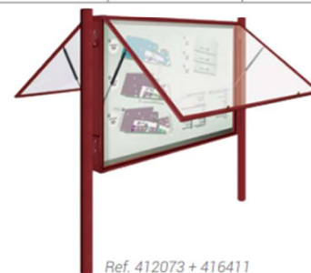
Ref. 412073 + 416411