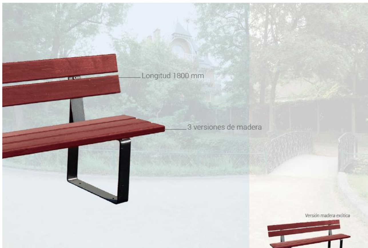
Versión madera exótica

>> Nueva versión: estructura galva & madera bruta << >> Versión madera exótica: cambio de longitud 1800 mm <<