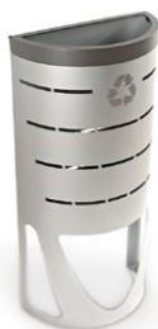
Lisboa Selectiva 40 l.

Para condiciones climatológicas extremas (alta salinidad, o alta temperatura, o alta humedad) el producto puede incluir un tratamiento especial adicional que implica un coste extra. Por favor consulte el coste extra adicional así como el pedido mínimo requerido.