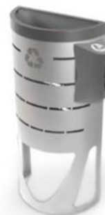
Dispensador de bolsas Can-Adapt