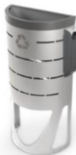
Ceniceros Kaizen 1 L y Valencia 2 L