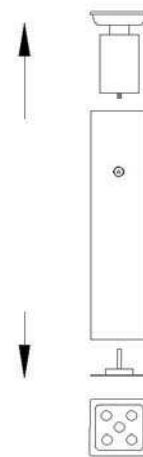
Detalle de extracción de recogecolillas y base