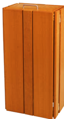
Versión estándar rectangular