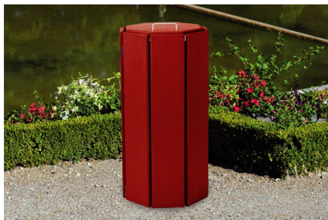
Versión estándar octogonal