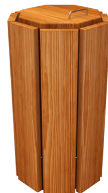
Versión Eco octogonal