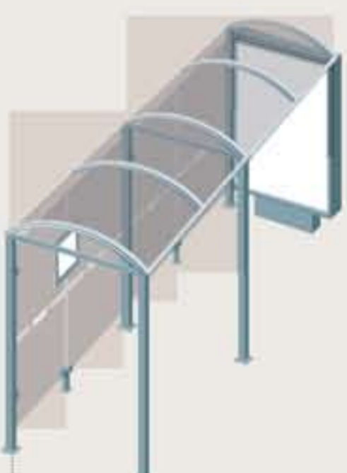
Sylt - Long. 5000 Una vitrina 3000 sobre pie central Ref. 529349