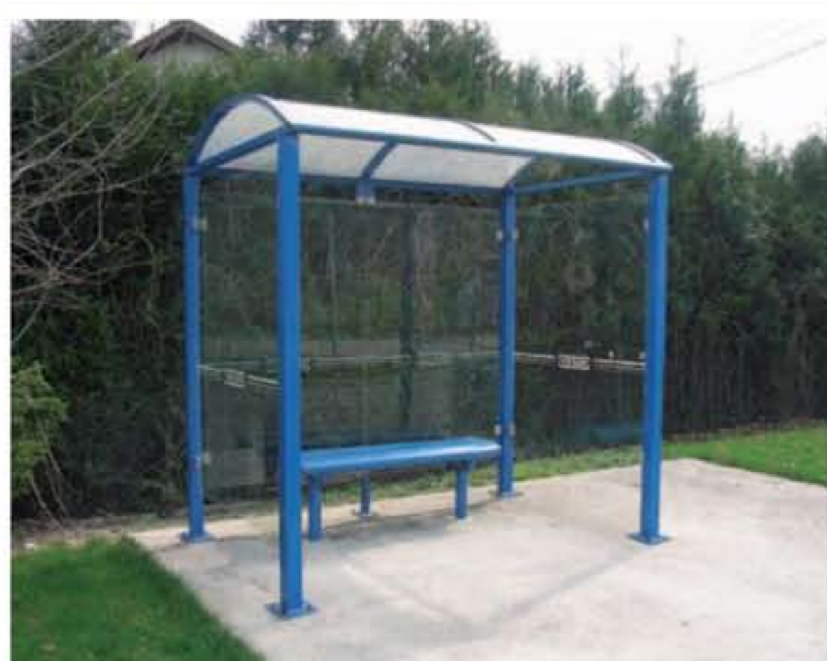
Modelo presentado : Malta - RAL 5010 - Ref. 529318