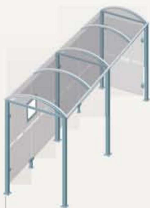
Oléron - Long. 5000 Un cerramiento lateral Ref. 529309