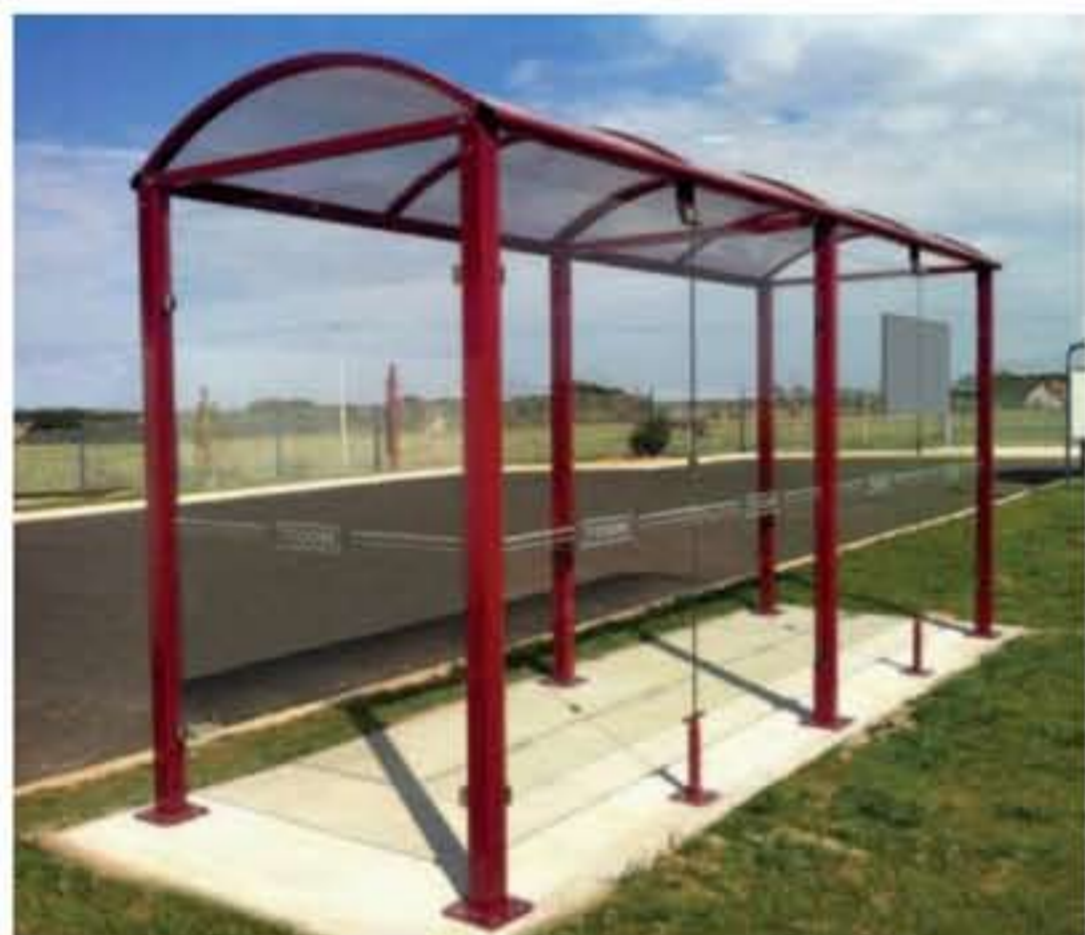
Modelo presentado : Oléron - RAL 3004 Ref. 529309