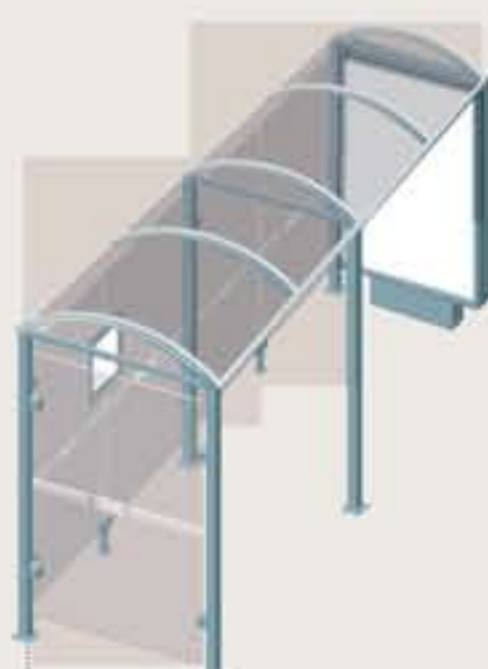
Rhodos - Long. 5000 Una vitrina 3000 sobre pie central + un cerramiento lateral Ref. 529359