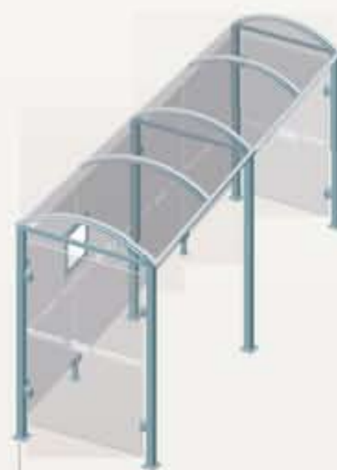
Malta - Long. 5000 Dos cerramientos laterales Ref. 529319