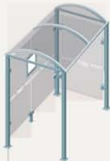
Oléron - Long. 2500 Un cerramiento lateral Ref. 529308