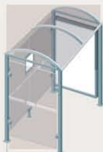
Lérins - Long. 2500 Una vitrina 2000 + un cerramiento lateral Ref. 529338