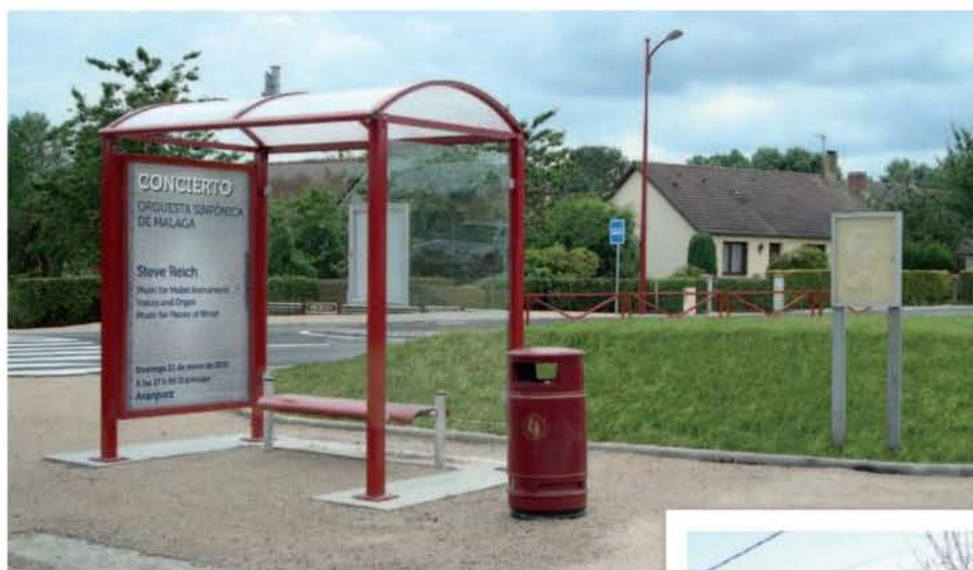
Modelo presentado : Lérins - RAL 3004 Ref. 529338

Atención : todas las dimensiones de bancos sin respaldo no son compatibles con nuestras marquesinas equipadas con una vitrina de información ó un cajón. Sírvase verificar la longitud de su banco : debe colocarse a 1 metro como mínimo de la vitrina de información o de un cajón (MUPIS).