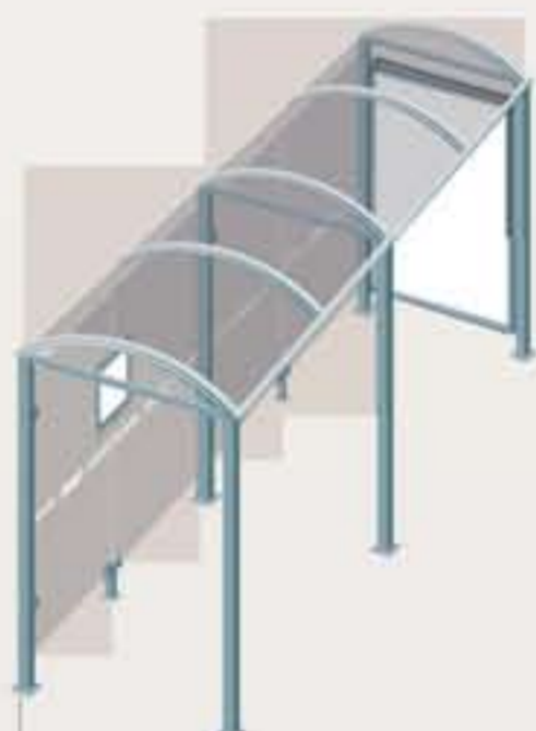
Orkney - Long. 5000 Una vitrina 2000 Ref. 529329