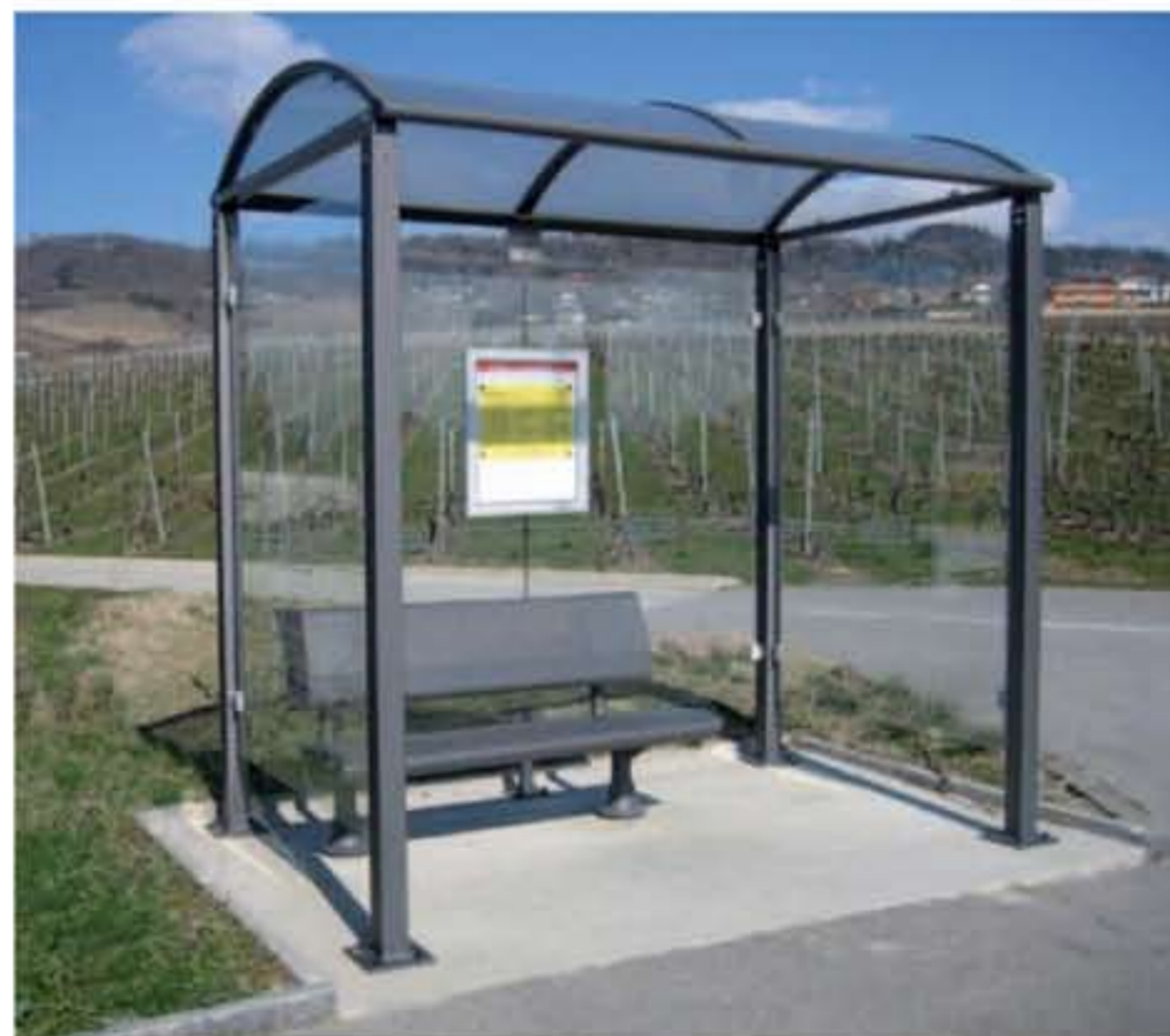
Modelo presentado : Malta - Gris PROCITY Ref. 529318