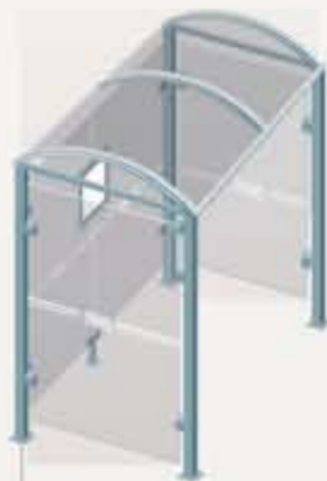
Malta - Long. 2500 Dos cerramientos laterales Ref. 529318