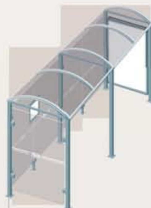
Lérins - Long. 5000 Una vitrina 2000 + un cerramiento lateral Ref. 529339