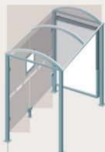
Orkney - Long. 2500 Una vitrina 2000 Ref. 529328