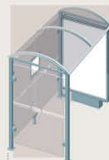
Rhodos - Long. 2500 Una vitrina 3000 sobre pie central + un cerramiento lateral Ref. 529358