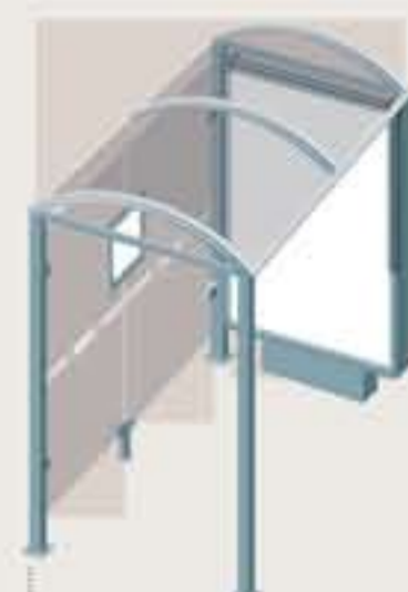
Sylt - Long. 2500 Una vitrina 3000 sobre pie central Ref. 529348