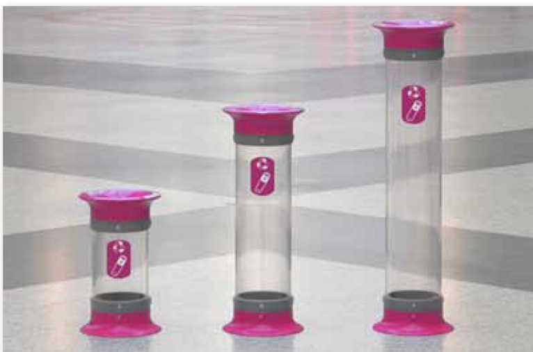
La gama C-Thru 5, 10 y 15