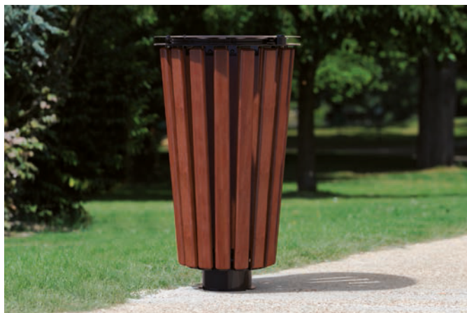
Versión acero y madera